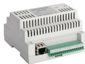
Obr. 2: MWGD 46XT.IP

Modul funkčně kompatibilní s předchozí verzí, navíc je osazen rozhraním pro přímé připojení na Ethernet pomocí TCP/IP protokolu (obr. 2). Na systémové lince tak může cenově i montážně výhodněji nahradit kombinaci modulu MWGD 46XT a převodníku RS 485 / TCP/IP.