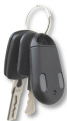
Tx Key-TF ID Key-TF