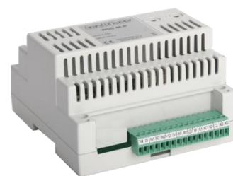
Obr. 1: NWGD 46

NWGD 46 umožňuje připojení čteček známých světových výrobců s libovolnou čtecí technologií (obr. 1) a/nebo ovládání bezdrátových zámků APERIO . Lze tak vyhovět požadavkům zákazníků na použití různých identifikačních technologií (HID Prox, iCLASS, Mifare, Mifare DesFire, Indala apod.) a přitom využít všech předností systému APS 400. Modul je navržen jak pro čtečky bez klávesnice, tak čtečky s klávesnicí, kde jednotlivé stisky kláves jsou interpretovány jako funkční kódy (důvody) pro docházkové aplikace nebo PIN kód.