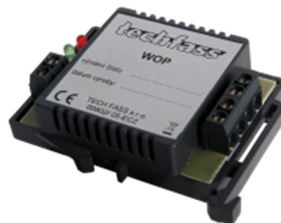
Obr. 1: Opakovač WOP

Opakovač WOP slouží k posílení datové linky WIEGAND , lze jej použít v systémech APS mini Plus a APS 400 nebo v obecných aplikacích. Dodává se v provedení vhodném k montáži na DIN lištu.