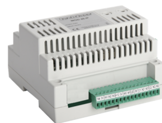
Obr. 1: NABA 46

NABA 46 umožňuje připojení čteček známých světových výrobců s libovolnou čtecí technologií ( obr. 1 ) a/nebo ovládání bezdrátových zámků APERIO . Lze tak vyhovět požadavkům zákazníků na použití různých identifikačních technologií (HID Prox, iCLASS, Mifare, Mifare DesFire, Indala apod.) a přitom využít všech předností systému APS 400. Rozhraní ABA Track II neumožňuje připojení čtečky s klávesnicí.